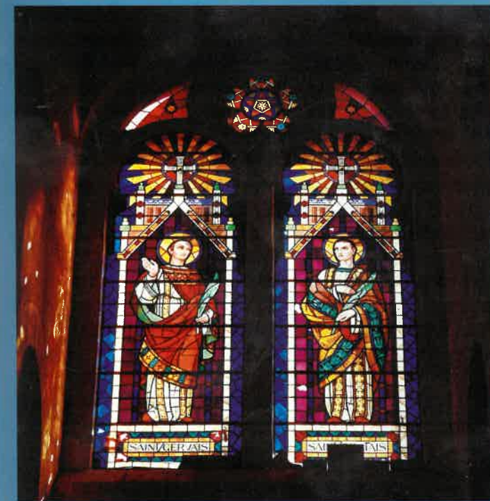
Vitrail Saint Gervais et Saint Protasius