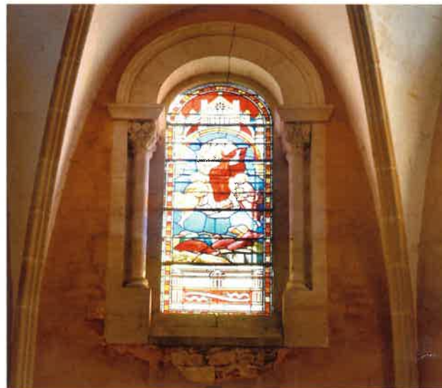
Vitrail de la Transfiguration

Plus facile d'accès, et par sa grande dimension, cette église permet d'accueillir des assemblées nombreuses lors des fêtes religieuses regroupant les huit clochers du secteur paroissial, ainsi que des manifestations culturelles.